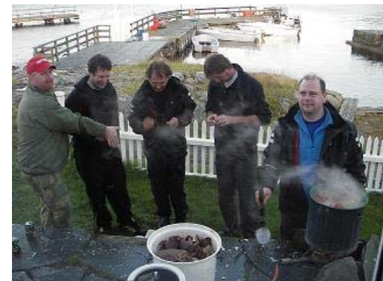
Krabbekoking på Merdø.